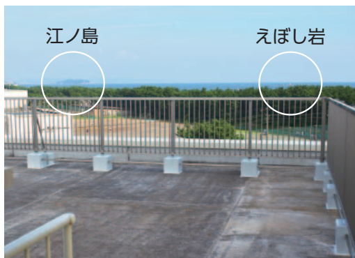
限りなく正面に烏帽子岩が見えます