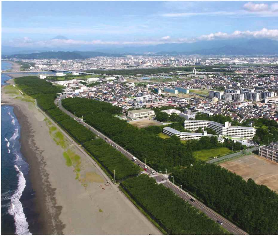
相模湾から富士山・箱根・丹沢連山を望む、またとない景観(撮影 2022年夏)。