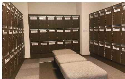
共用部分のリニューアルを随時行っています。ロビー、食堂、外壁等の大規模修繕は既に完了し、最近では大浴場の床(入口はスロープ)、下足室を一新しています。

備え、お暮しの皆様が自然体でご自分らしく過ごせる環境を整えています。また敷地内にある協力病院や訪問介護事業所との連携など、健康・介護面のサポート体制もご安心いただけます。 ぜひ一度、春の郷にご見学にお越しください。他にはない、穏やかな環境を見つけていただけるはずです。