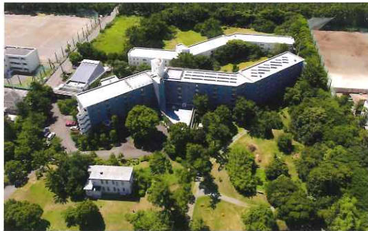
散歩も楽しい、広く自然豊かな庭園。

湘南の海を傍らに、富士山を眺望できる景観に恵まれた太陽の郷は、四季折々の花々や植栽が溢れる九千坪の敷地にあります。この環境の良さが、太陽の郷を選ばれる方々の一番の理由。今の季節は、郷内をそよぐ柔らかな春の海風を感じられます。 ”心身に備わる健康を自らの力で引き出す”という療養哲学のもと、温水プールや多目的ホール、送迎バスなどを