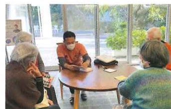
講演前のサイン会の様子