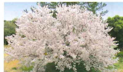
タイミングが良ければ、太陽の郷の桜を鑑賞いただくことができます。