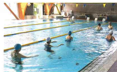
温水プールで健康維持